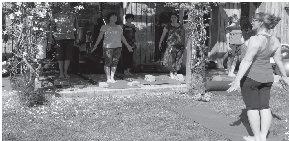
TABLEAU PAGE MILIEU